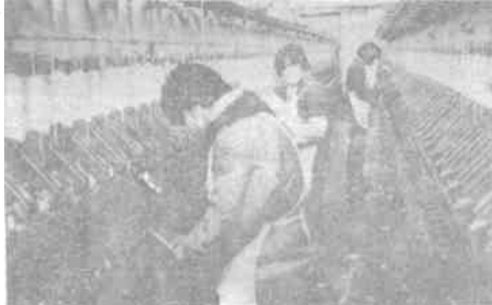
利津县明集乡齐家村大力发展工副业，全村工副业收入占总收入的70%以上。图为该村纺纱厂一角。

立，成立了速印部，仅半年的时间，速印部就盈利3万元。《条例》下发后，这个厂加快了转换机制的步伐，将9个车间化分为3条独立的专业化生产线：即书刊印刷线、包装装潢印刷线和票证零活印刷线。这三条生产线有生产经营自主权，直接服务用户，大大增强了竞争力。（庄岩）