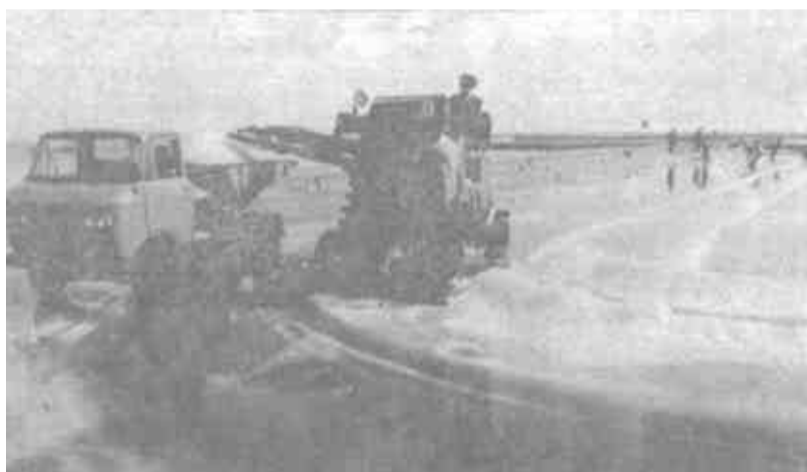
东营区龙居乡盐场紧紧抓住今年雨水少的有利时机，采取措施增产增收。截止11月初，全乡1200亩盐滩已产原盐11000吨，产值165万元，利税100万元。图为盐滩一角。

张庆黎说，这次现场会推出的经验实在、具体，令人振奋和鼓舞，今年，全市各县区、各乡镇克服干旱等自然灾害带来的困难，全民动员，林业生产有了新突破。他要求，各地要加强领导，落实措施，扎扎实实地搞好秋冬林